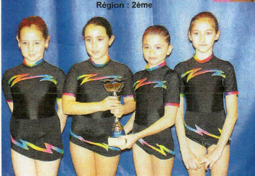
Département : 1ère Région : 2ème