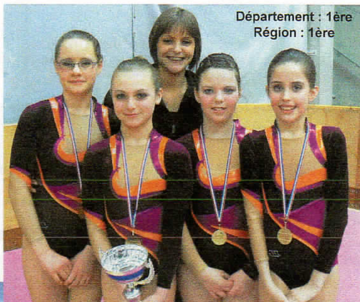
Département : 1ère Région : 1ère