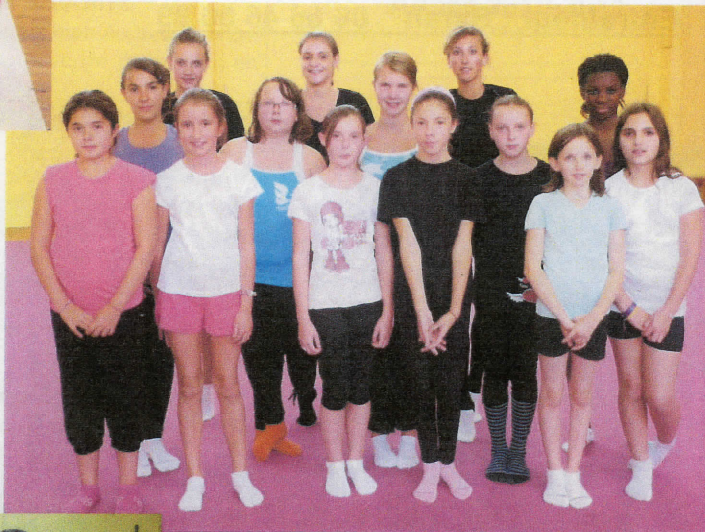
Loisirs Mercredi Ap. midi