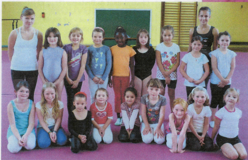
Initiation Samedi Ap. midi