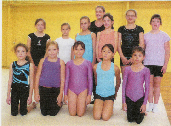
Coupe-Formation 2 et 3 Mercredi Ap. midi