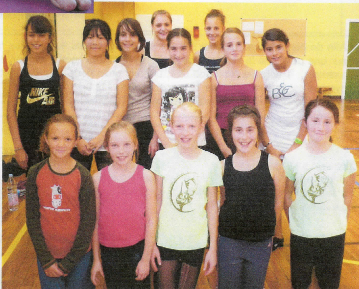
Ensembles DC2 Individuelles Dir-Crit Samedi Ap. midi